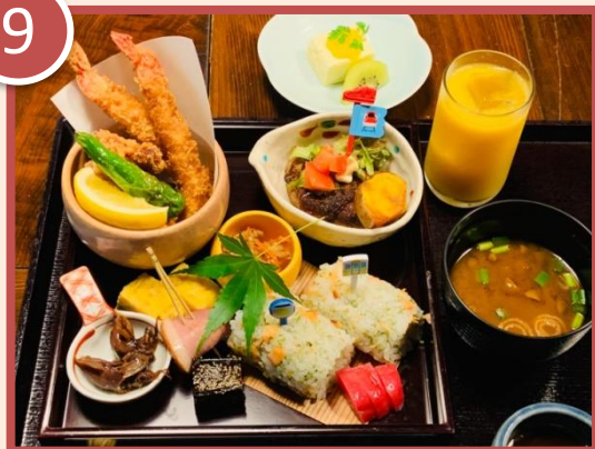
しょくのくら あらため 食の蔵 荒為